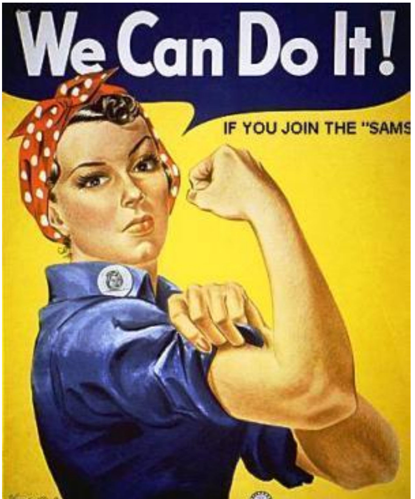
Affiche publicitaire américaine de 1943